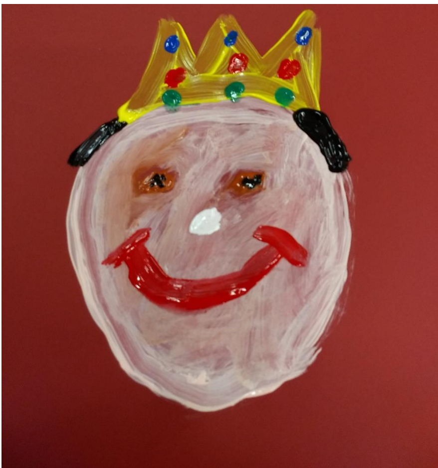
Umut, Klasse 3

Im Folgenden erhalten Sie genauere Informationen über die einzelnen Betreuungsmöglichkeiten.