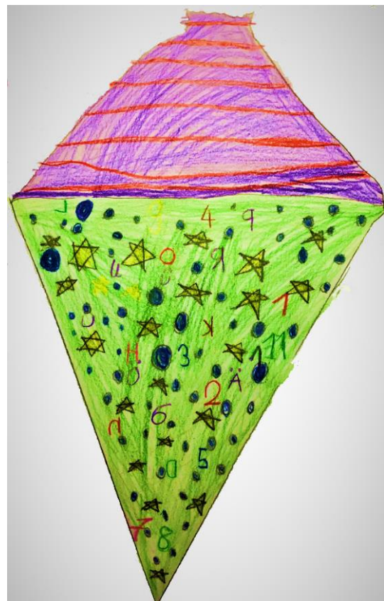
Elisa, Klasse 1

Weitere Informationen, sowie einen Film, in dem wir uns vorstellen, finden Sie auch auf unserer Homepage: https://www.oberwaldschule.de/