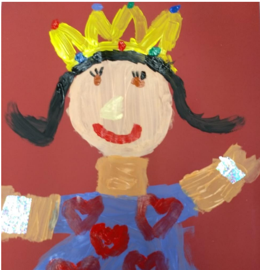
Luana, Klasse 3

Uns ist es wichtig, dass sich Ihre Kinder in der Schule wohl fühlen und sie ihre Fähigkeiten entdecken und entwickeln können.